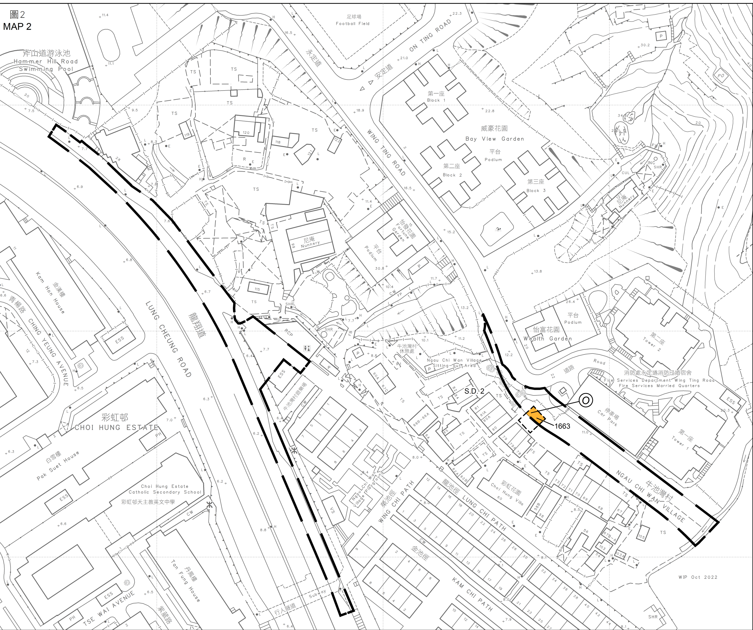
比例尺 SCALE 1:1 000 metres 20 0 20 40 60 80 100 metres