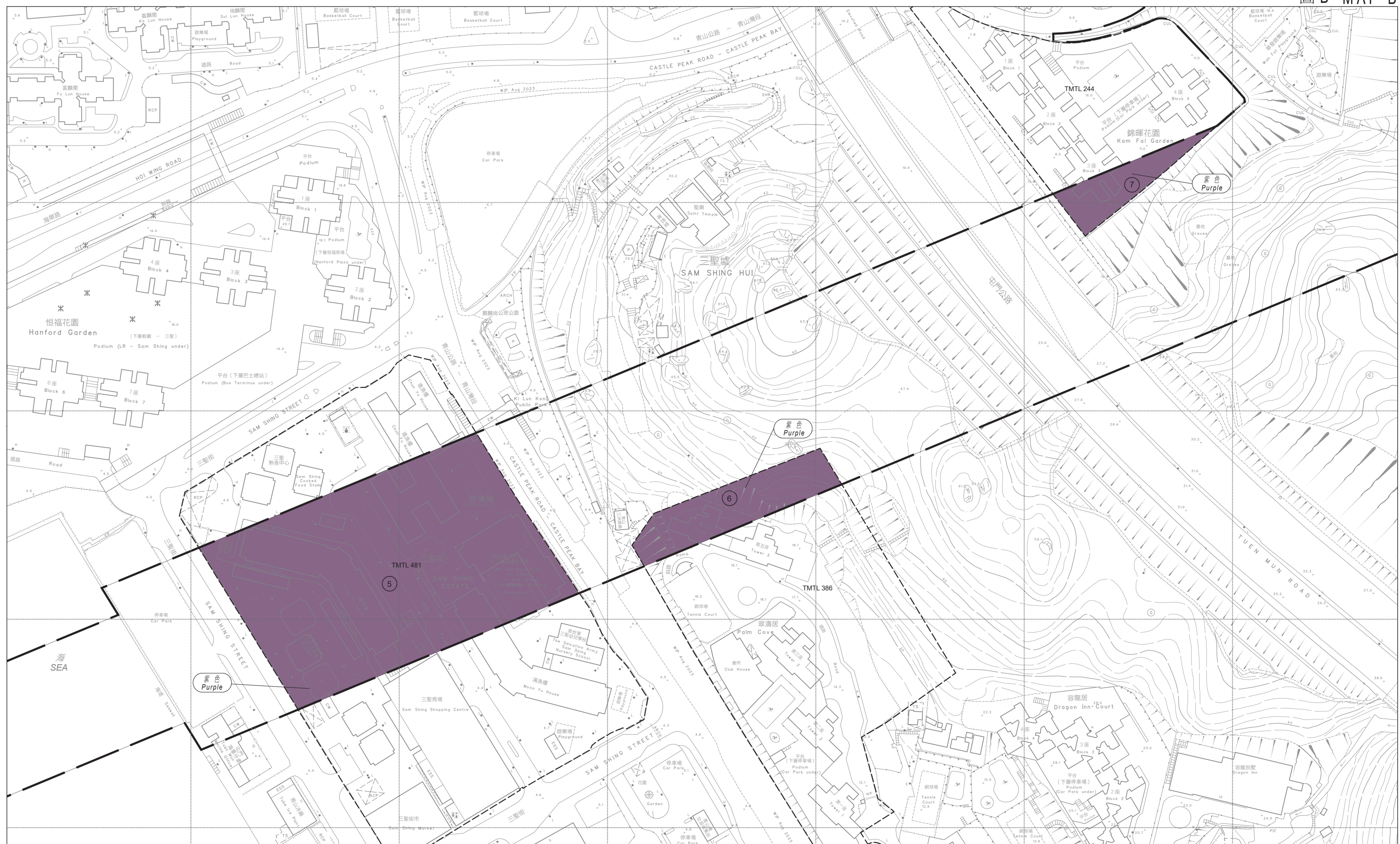
比例尺 SCALE 1:1 000 metres 20 0 20 40 60 80 100 metres